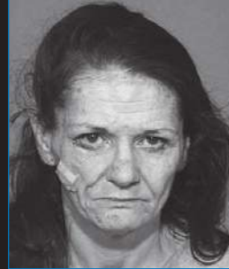
...y dos años y medio más tarde

E mpecé a usar metanfetamina de cristal cuando era estudiante del último año de bachillerato. Antes de que mi primer semestre en la universidad terminara, el met se convirtió en un problema tan grande que tuve que dejar mis estudios. Tras horas de estar mirándome en el espejo picándome, me veía como si tuviera varicela. Pasaba todo mi tiempo consumiendo met o tratando de conseguirla”.