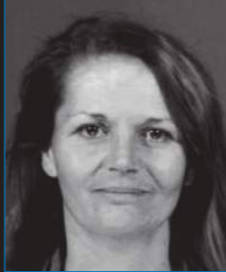
Consumidora de metanfetamina en 2002

Consecuentemente, es una de las adicciones a las drogas más difíciles de tratar y muchos mueren en sus garras.